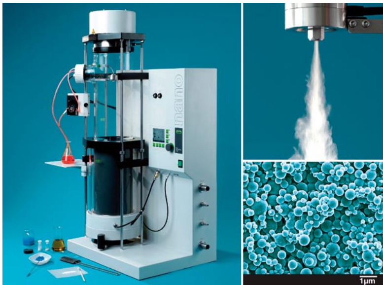
Die Firma Büchi Labortechnik wagte den Sprung in die Nanotechnologie: Weltneuheit Nano Sprühtrockner B-go